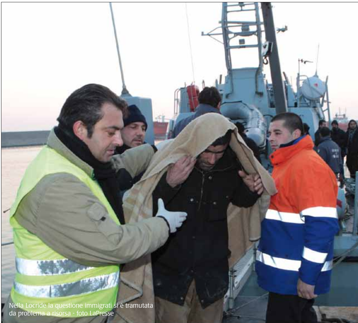
Nella Locride la questione immigrati si è tramutata da problema a risorsa

a piani di fabbricazione o alla realizzazione di opere pubbliche di cui nessuno potrà mai usufruire se non ci sono le persone. Tutte queste opere che si vorrebbero fare, in realtà giustificerebbero colate di cemento e speculazioni arbitrarie di cui giova soltanto la criminalità organizzata. Quello di cui abbiamo bisogno sono gli operatori dei servizi sociali, e dunque educatori e mediatori linguistici e culturali per permettere a questi migranti e ai loro figli di integrarsi alla popolazione locale e costruire insieme una comunità coesa. Questi sono i problemi che un amministratore deve affrontare