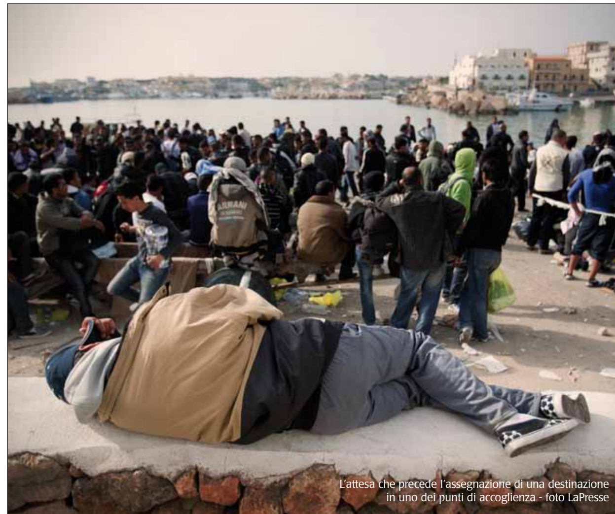
L'attesa che precede l'assegnazione di una destinazione in uno dei punti di accoglienza

abitanti. È anche vero che è necessario fare un distinguo tra immigrati e rifugiati, perché non tutti i migranti possono ottenere lo status di rifugiato. Questo è un altro dei motivi di confusione e di discussione.