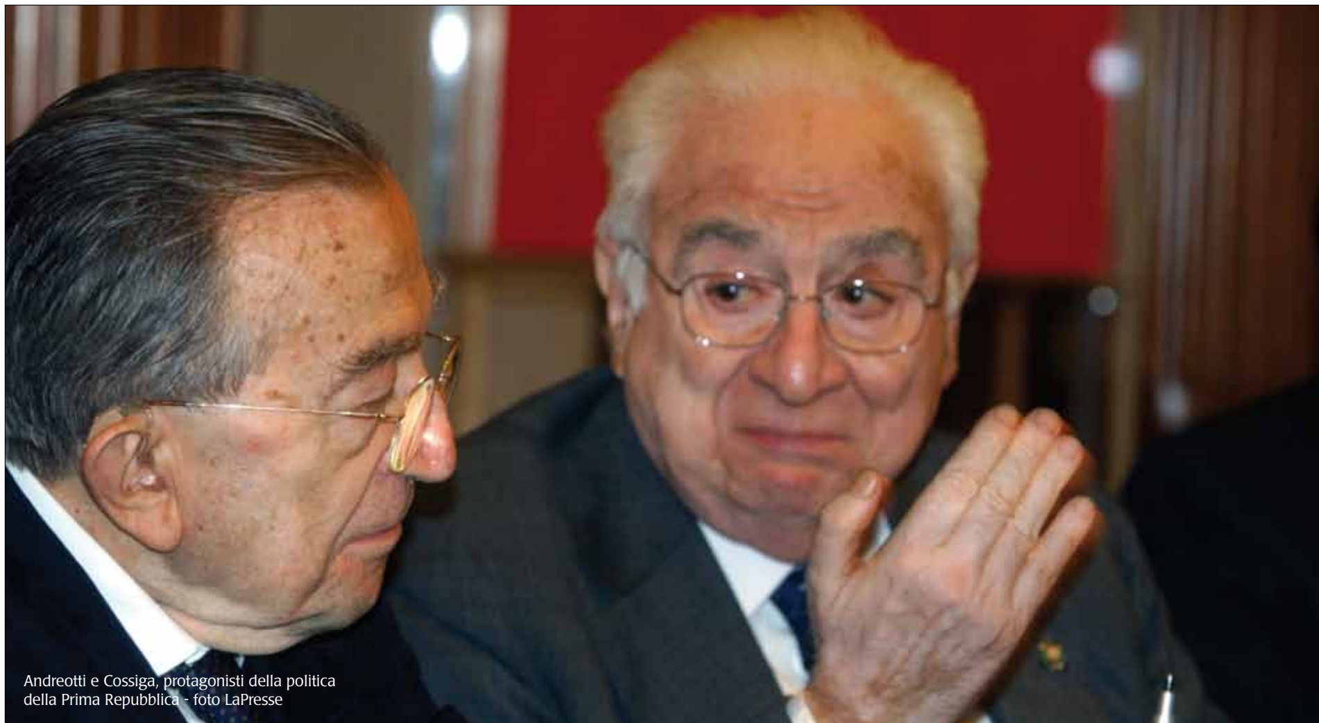
Andreotti e Cossiga, protagonisti della politica della Prima Repubblica

STIAMO ASSISTENDO AD UN RITORNO DELL'USO DEL TEATRO COME VERO E PROPRIO STRUMENTO DELLA COMUNICAZIONE. SI MOLTIPLICANO I CASI IN CUI GIORNALISTI, AUTORI E REGISTI COLLABORANO PER METTERE IN SCENA SPETTACOLI CHE TRATTANO TEMI POLITICI E DI CRONACA