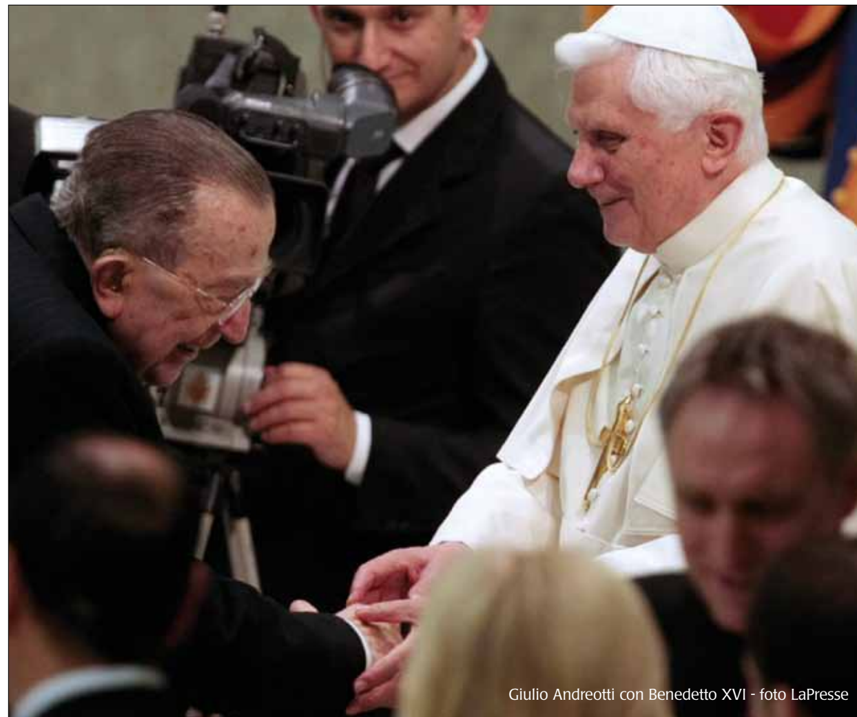
Giulio Andreotti con Benedetto XVI

aprile al 'Teatro della Cooperativa' di Milano e coprodotto dalla 'Bottega dei mestieri teatrali', che prosegue: "Cinquant'anni di democrazia, però, hanno un peso. Grazie alla tenacia di giornalisti, scrittori, a certo cinema e a certo teatro, grazie anche ad alcuni politici, oltre che ad una schiera nutrita di magistrati che hanno rischiato moltissimo o pagato in prima persona, grazie a tutti questi noi sappiamo che la Giustizia in Italia, in questi casi emblematici, quasi sempre è rimasta lei latitante, complice o vittima di insabbiamenti, depistaggi, corruzioni, sempre a favore dei potenti. Il popolo italiano (non solo quello siciliano sia ben chiaro) vittima di ingiustizie millenarie, di