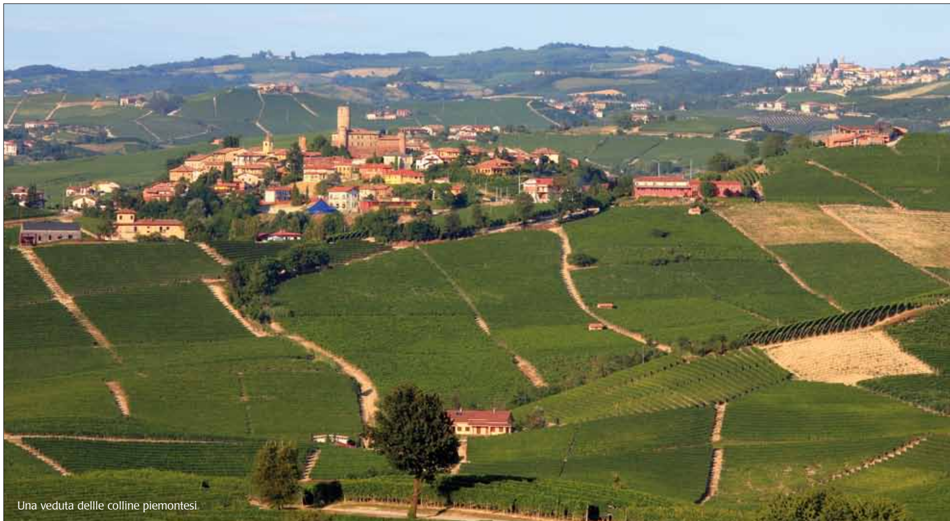
Una veduta delle colline piemontesi