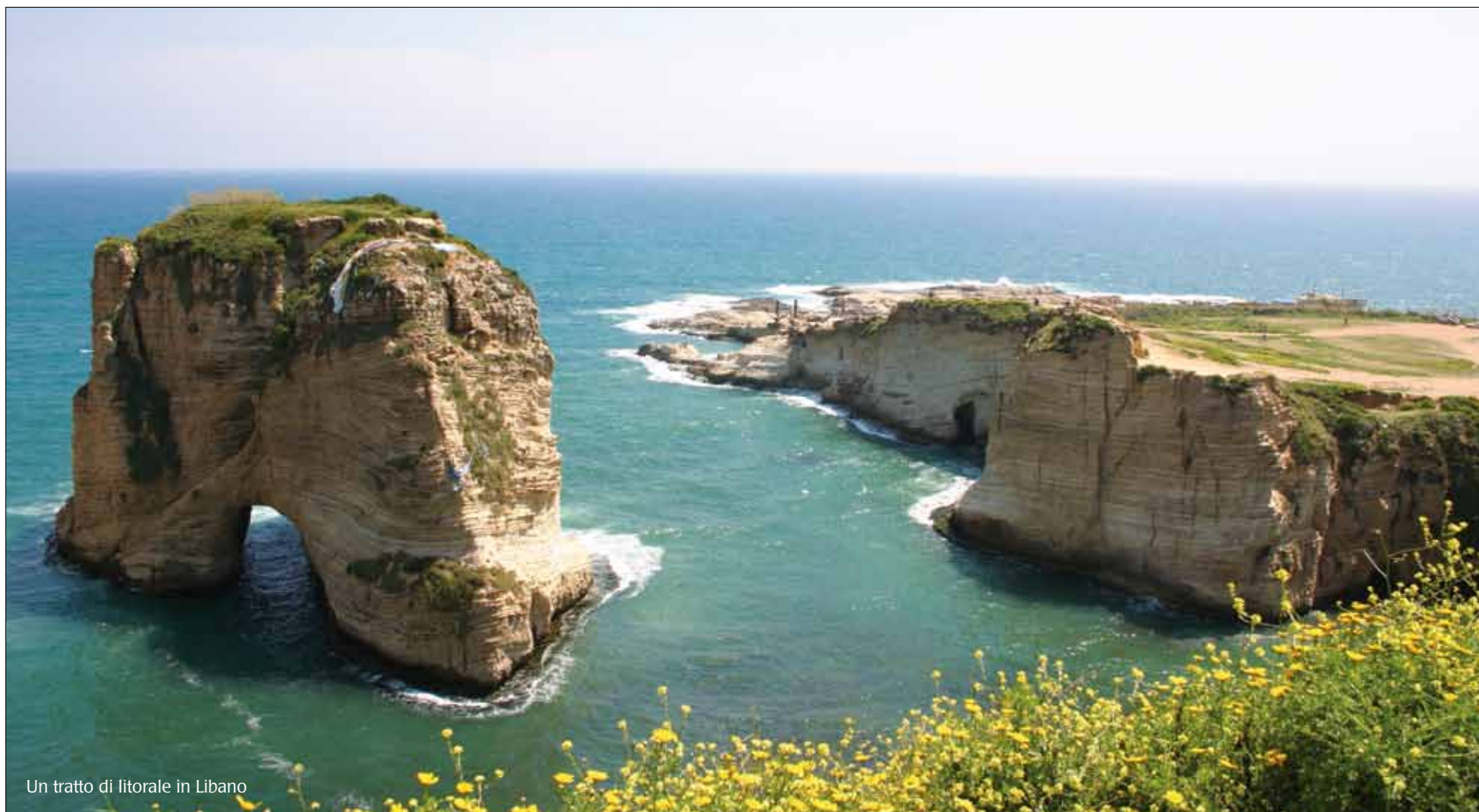
Un tratto di litorale in Libano

È cominciato in queste settimane la Campagna Nazionale per la prevenzione del tumore al seno nella Regione della Bekaa in Libano, un progetto co-finanziamento dalla Regione Sardegna che coinvolgerà l'Hopital Gouvernemental du President Elias Hraoui, presso la città di Zhale. Nell'ottica dello scambio di competenze e del dialogo, l'ospedale Sirai di Carbonia ha sviluppato protocolli di prevenzione e protocolli terapeutici che potranno essere applicati nella provincia libanese, dove negli ultimi anni il tasso di mortalità a causa di tumore al seno è cresciuto esponenzialmente, a causa dell'inquinamento delle falde acquifere dovuto all'uso eccessivo di fertilizzanti ed in particolare di nitrati. Il progetto prevede in questa prima fase un percorso di aggiornamento del personale medico e paramedico libanese e, successivamente, una campagna di prevenzione nel distretto di Zhale che coinvolgerà 10 mila donne.