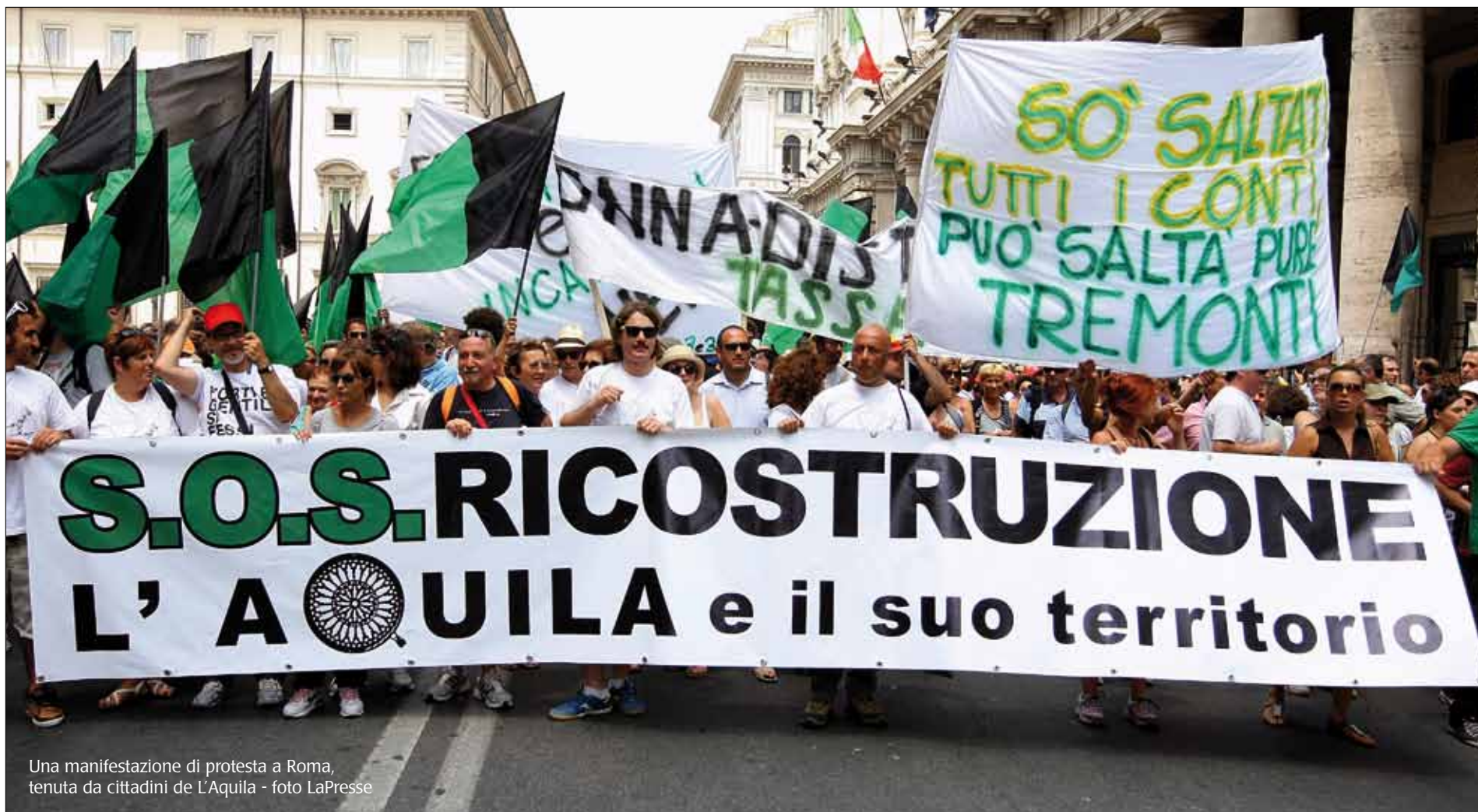
Una manifestazione di protesta a Roma, tenuta da cittadini de L'Aquila

ALLA DOMANDA SU QUALI SIANO LE CONDIZIONI DEL CENTRO STORICO, LA RISPOSTA SI RIPETE IDENTICA DA MESI: IL CENTRO STORICO DELL'AQUILA, IL QUINTO CENTRO D'ARTE D'ITALIA, È ANCORA COSÌ, FERMO A COM'ERA ORMAI QUASI DUE ANNI FA