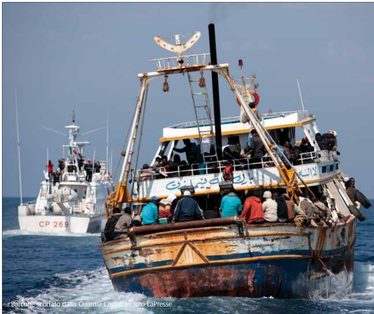
Barcone scortato dalla Guardia Costiera